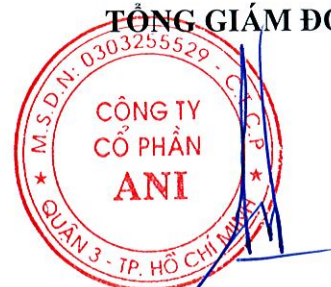
Đặng Tất Thành